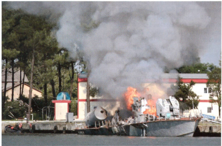
Das Raketenschnellboot «Tbilisi» der «Matka»-Klasse der georgischen Marine – seinerzeit von der Ukraine geliefert – zerstört und versenkt im Hafen von Poti.

Das seinerzeit von der Ukraine gelieferte Raketenschnellboot «Tbilisi» der «Matka»-Klasse wurde durch eine SS-N-9 «Malakhit» (NATO Bezeichnung «Siren») der «Mirazh» versenkt und die anderen Boote, darunter die