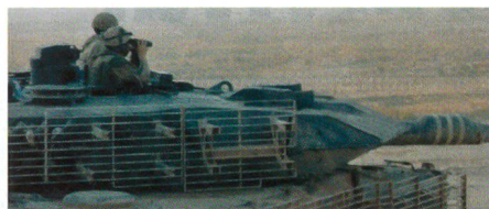
Nahaufnahme Leopard 2A6M CAN.

Nach Übernahme und Einführung der Kampfpanzer des Typs Leopard 2 in verschiedenen Ausführungen, arbeiten die kanadischen mechanisierten Truppen zurzeit daran, den Leopard optimaler den asymmetrischen Bedrohungen, welchen die Truppe in Afghanistan momentan begegnet, anzupassen. Hauptpunkte sind dabei Panzerung und Klimabedingungen. Während die Frontalpanzerung von rund einem Meter im Turmbereich nicht gebraucht wird, ist ein besserer Rundumschutz nötig gegen Panzerfäuste sowie Panzerabwehr lenk Waffen, Panzerminen, improvisierte Sprengkörper und schwere Maschinengewehre respektive Maschinenkanonen. Es wurde erkannt, dass die Temperatur im Fahrzeuginnen unbedingt unter 50 Grad gehalten werden muss, damit die Truppe bei längeren Einsätzen nicht an den Folgen der Hitze leidet und die Einsatzfähigkeit eingeschränkt wird; dies soll mit dem Einbau einer leistungsfähigeren Klima-