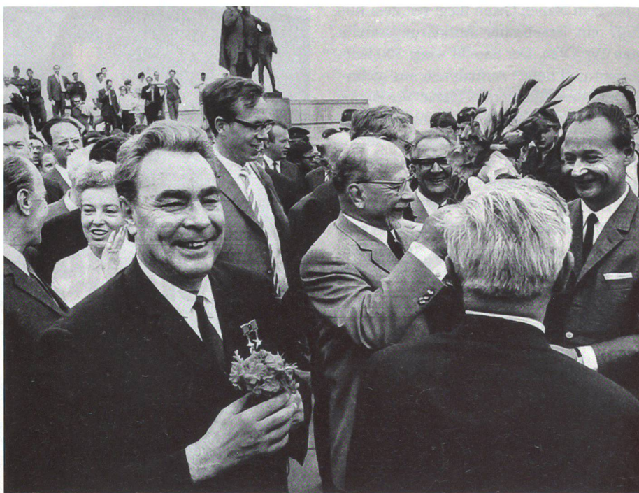
Bratislava, Anfang August 1968 – ein politisches Bild, das täuscht: Links der sowjetische Parteichef Leonid Breschnew, der kurz darauf den Einmarsch in die Tschechoslowakei anordnete, in der Mitte der DDR-Staats- und Parteichef Walter Ulbricht, rechts der tschechoslowakische Parteivorsitzende und Reformier Alexander Dubcek.

Anfang Januar 1968 hatte die Moskauer Parteispitze eher wohlwollend zugehört, als Alexander Dubcek, die Leitfigur und der Kopf der Prager Reformer, den Altstalinisten Antonin Novotny an der Spitze der Kommunistischen Partei der