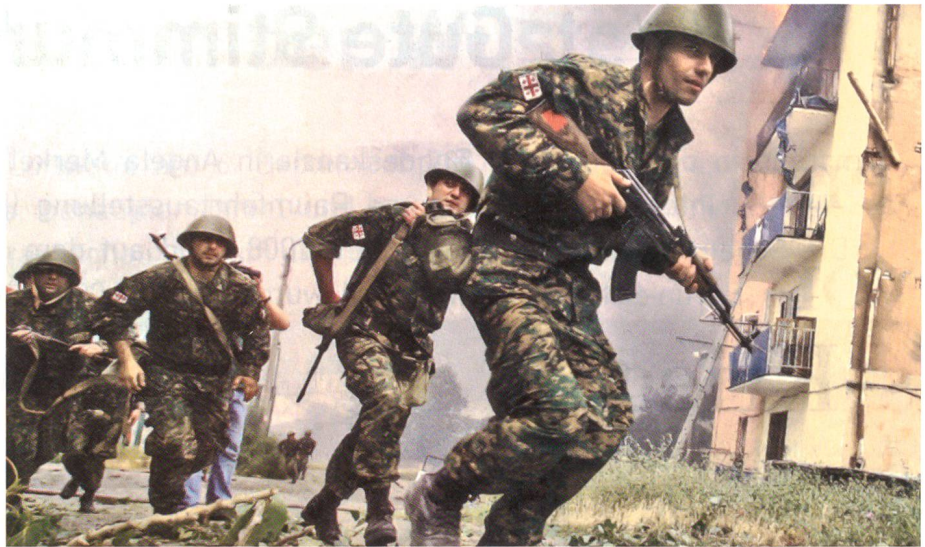
Georgische Infanteristen in der Stadt Gori. Es dürfte sich um ein gestelltes Bild handeln. Der zweite Füsilier trägt das Gewehr untergehängt, der dritte gar am Rücken. Man beachte die glänzenden Helme und die weissen Abzeichen an den Oberarmen.

Am vierten Kampftag, am 11. August, stiessen russische Panzerspitzen ins georgische Kernland vor. Von Abchasien aus nahmen sie in Grenznähe die Stadt Sugdidi ein. Dann eroberten sie die Ortschaft Senaki, die 40 Kilometer von Abchasien entfernt