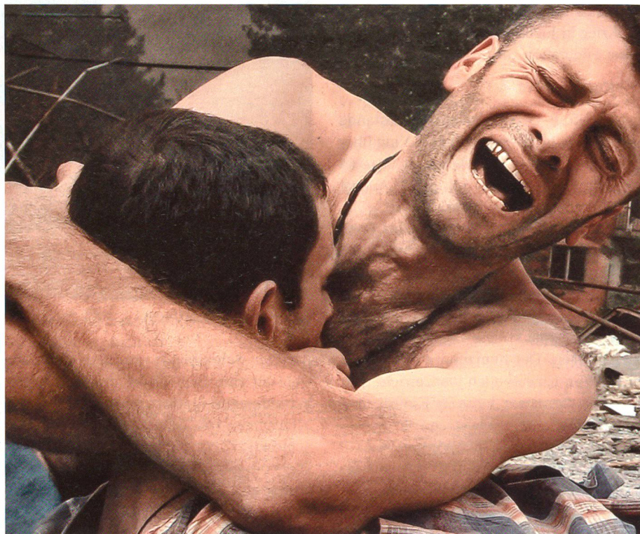
In der Stadt Gori hält ein Mann einen getöteten Bruder im Arm.