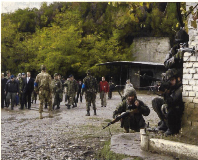
Der Sonntag stand ganz im Zeichen der Besucherdelegation.