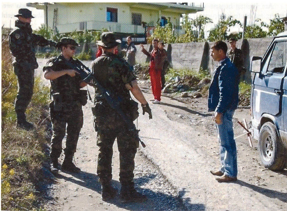
Ausbildung in Personen- und Fahrzeugdurchsuchung.

Dank gutem Zureden der Kameraden schafften alle problemlos die erste Hälfte der Strecke; danach brauchte es jedoch