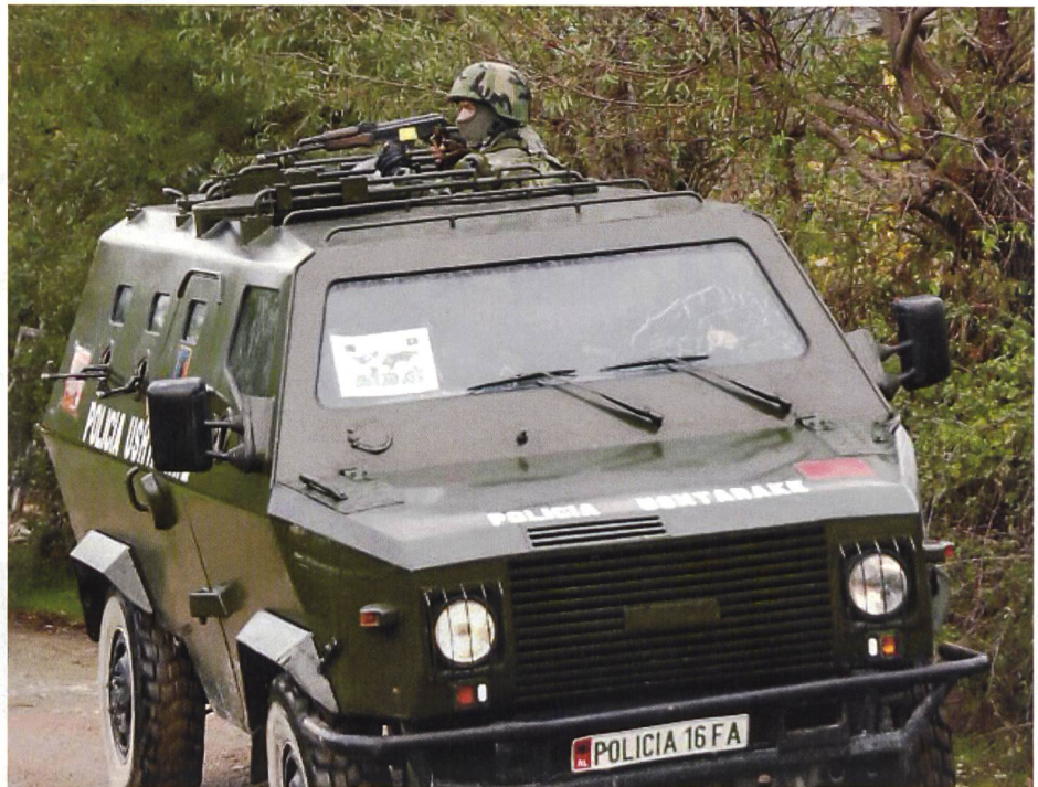
Am letzten Tag noch einmal voller Einsatz für die Bataillonsübung.

An diesem letzten Übungstag stand die Bataillonsübung auf dem Programm, bei der die A, B und C-Coy für die albanische Delta Kompanie günstige Voraussetzungen für einen Angriff schaffen mussten. Über die vom Regen überfluteten Strassen gelangten wir schliesslich an unseren Checkpoint-Standort. Auf einer vielbefahrenen Strasse einen MCP zu errichten, war keine leichte Aufgabe. Die Anwohner und zivilen Strassenbenützer