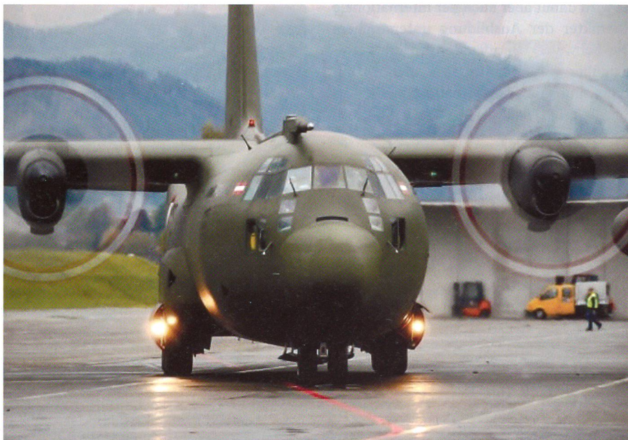
Mit der Hercules des österreichischen Bundesheeres ging es nach Tirana.

Am Ausbildungsplatz angekommen, hatten wir nach einer Kurzeinführung die Gelegenheit, mit den Ordonanzwaffen der Briten, Albaner und Österreicher zu schiessen. Nach dem Lunch wurden wir anhand eines Parcours mit den albanischen Fahrzeugen, den Sprech/Funkregeln, dem Beobachtungsposten sowie dem Casevac/Me-