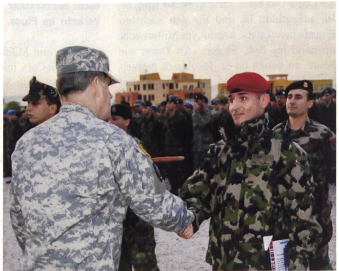
Abschlusszeremonie am späten Nachmittag.