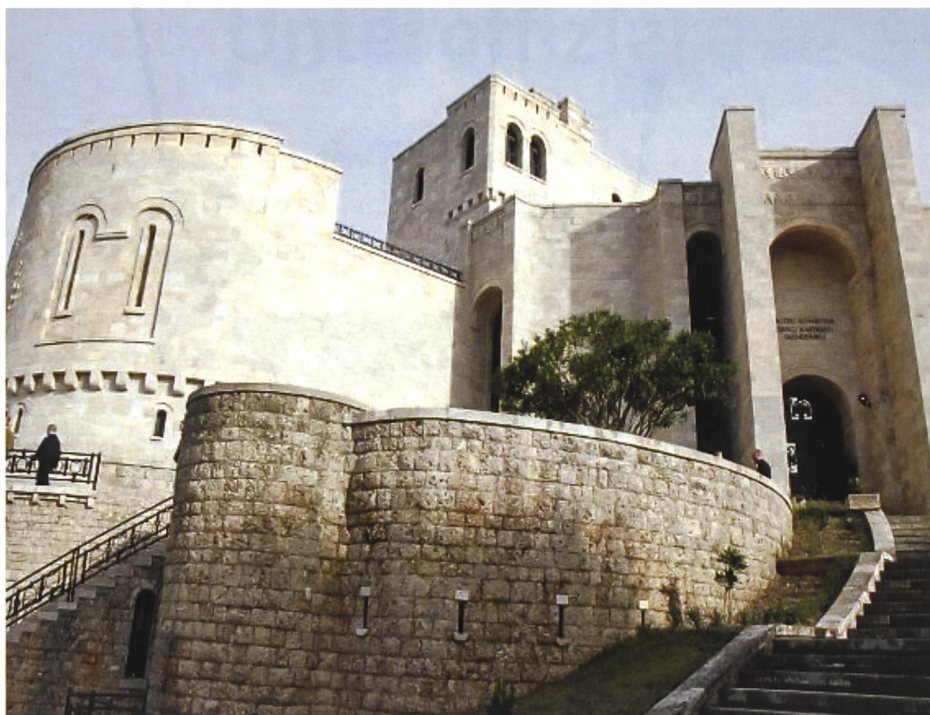
Auch die Kultur kam nicht zu kurz – Besuch der historischen Ortschaft Kruja.

mehr als nur aufmunternde Worte. Tatkräftiges Schieben war bei einigen sehr willkommen und auf diese Weise erreichten alle, wenn auch erschöpft, das Ziel. Nun ging es darum, den Wurfkörper – eine alte Handgranate ohne Zünder und Sprengstoff – aus 25 Metern in ein 4 x 2 Meter grosses Feld zu werfen.