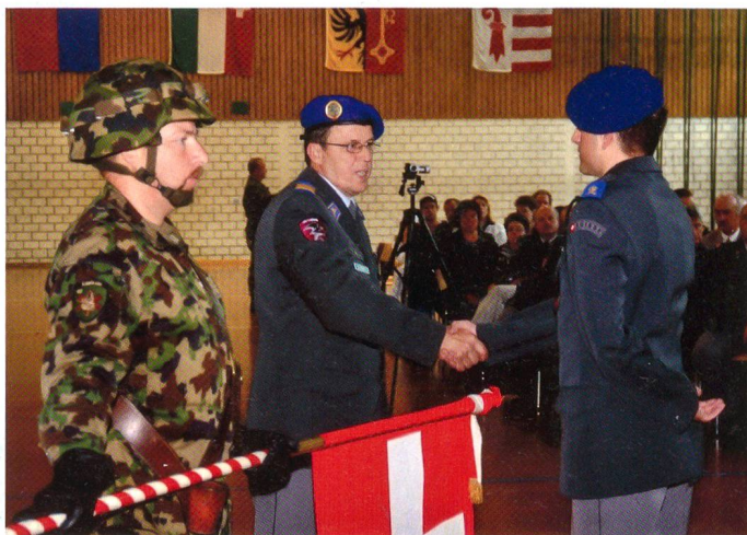
Beförderung mit Handschlag zum Wachtmeister.

Wo früher direkt nach Kaderschulen beverdiert wurde, muss der Anwärter als «Abverdienenden» den praktischen Dienst in seiner RS-Einheit absolvieren. In der Theorie Wissen erwerben ist das eine. Sich in der Praxis im Können bewähren ist das andere.