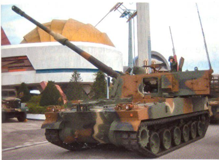
Panzerhaubitze K9 Thunder.

Bei der Ausschreibung der australischen Streitkräfte für bis zu 30 gepanzerte Hauptzen mit Kanonen im Kaliber 155 mm und einem Kaliber-52-Rohr haben sich lediglich zwei Hersteller gemeldet. Sowohl der deutsche Bewerber Krauss-Maffei Wegmann mit der Panzerhaubitze 2000 als auch der koreanische Bewerber Samsung mit der K9 Thunder steigen mit Raupenfahrzeugen ins Rennen. Zusätzlich zu den Waffensystemen wurde in der Ausschreibung die Offerte eines Servicepaketes über 7 Jahre verlangt, damit eine Vollkostenrechnung der Systeme erstellt werden kann.