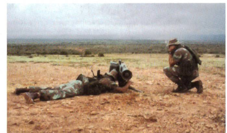
Testabschuss MILAN 3 in Südafrika.

Die südafrikanischen Streitkräfte haben nach erfolgreichen Tests die Panzerabwehrwaffe MILAN 3 als Nachfolger für die veralteten MILAN 1 bestätigt. Beim Versuch, bei welchem ebenfalls eine verbes-