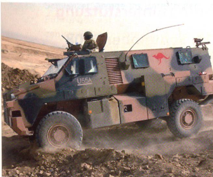
Australischer Bushmaster im Einsatz im Irak.

Im Rahmen einer dringenden Beschaffung hat die britische Beschaffungsbehörde eine unbekannte Anzahl von gepanzerten Bushmaster 4x4-Fahrzeugen des Herstellers Thales Australia bestellt. Die Fahrzeuge werden mit einem elektronischen Abwehr-