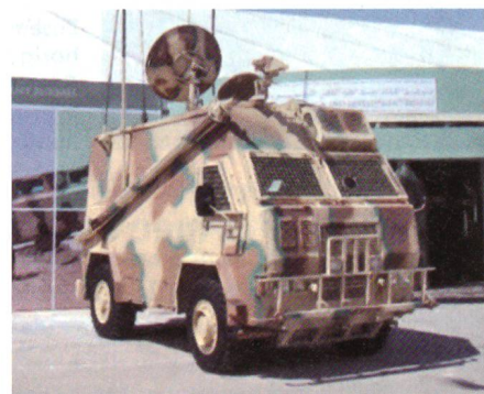
Jordanisches Kommandofahrzeug auf Basis des OMC RG 12.

Die jordanischen Streitkräfte beabsichtigen den Kauf von 10 mobilen Kommandoposten, welche durch ein jordanisch-südafrikanisches Gemeinschaftsunternehmen auf Basis des Fahrzeuges OMC RG 12 aufgebaut werden sollen. Beim leichtgepanzerten Fahrzeug wurde das Dach um 45 cm erhöht und der Innenraum in die Bereiche Fahrer, Kommunikation und Führung aufgeteilt. Maximal können 8 Personen als Besatzung mitgeführt werden. Das Fahrzeug verfügt über eine leistungsfähige Kommunikationsanlage sowie Flachbildschirme zur Darstellung des Gefechtsführungssystems.