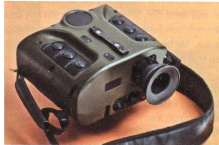
Tragbares Wärmebildgerät des Herstellers Elop.

Der israelische Rüstungshersteller Elop (Elbit Systems Electro-Optics) hat ein neues tragbares Wärmebildgerät mit der Möglichkeit zur Zielbeleuchtung vorgestellt. Es