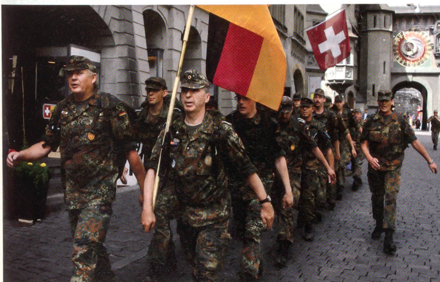
Marschgruppe der Bundeswehr in Schritt und Tritt.