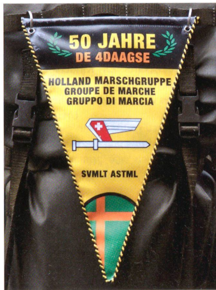
Darf mit Stolz getragen werden.