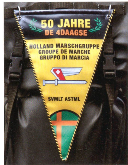
Darf mit Stolz getragen werden.