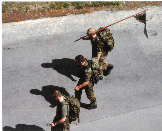
Kameraden aus Deutschland.