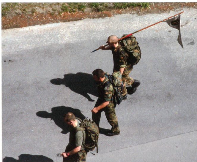
Kameraden aus Deutschland.