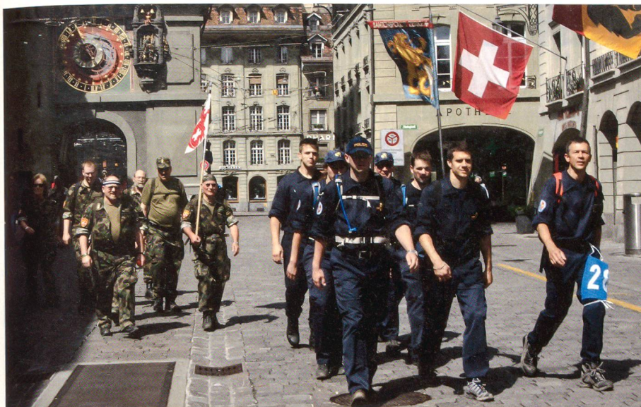
Durch die malerische Altstadt von Bern.