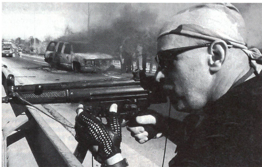
Söldner im Irak. Sie tragen keine Uniform und erscheinen in keiner Statistik.

Blackwater ist die grösste amerikanische Privatsicherheitsunternehmung und nicht unbestritten. Ihre Einsätze im Irak geben militärisch und politisch immer wieder