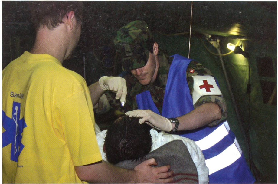
Ziviles und militärisches Sanitätspersonal kümmert sich professionell um einen Patienten.

Eine Module Sanitätshilfsstelle, eingerichtet in einer grossen Halle in der Nähe des St. Jakob-Stadions, ist bereit für den Ernstfall. Angehörige der Sanitätskompanie 42/4 arbeiten hier mit zivilem Sanitätspersonal Hand in Hand. Kurz vor Anpfiff des Spiels Holland–Russland wird der erste Notfall eingeliefert. Eine Ambulanz fährt vor, sofort kümmern sich die Helfer um die Person. Der Eingelieferte ist nicht ansprechbar. Der Militärarzt prüft sofort die Herz- und Atemtätigkeit, anschliessend den Blutdruck. Vermutlich wird dieser Patient ein Fall für eine Spitaleinweisung. Bis in die frühen Morgenstunden werden die auf dem ganzen Stadtgebiet verteilten Sani-