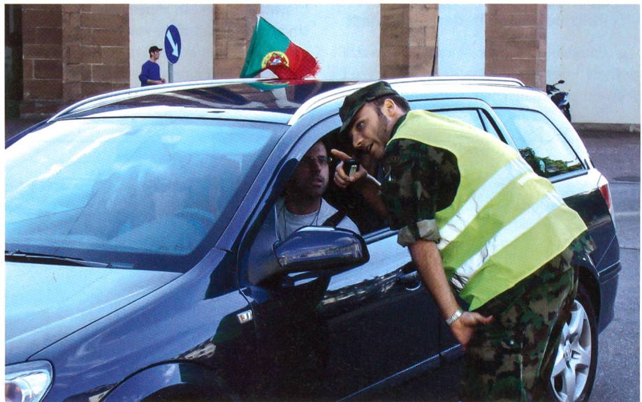
Ein Armeeeingehöriger erklärt einem Automobilisten den Weg.