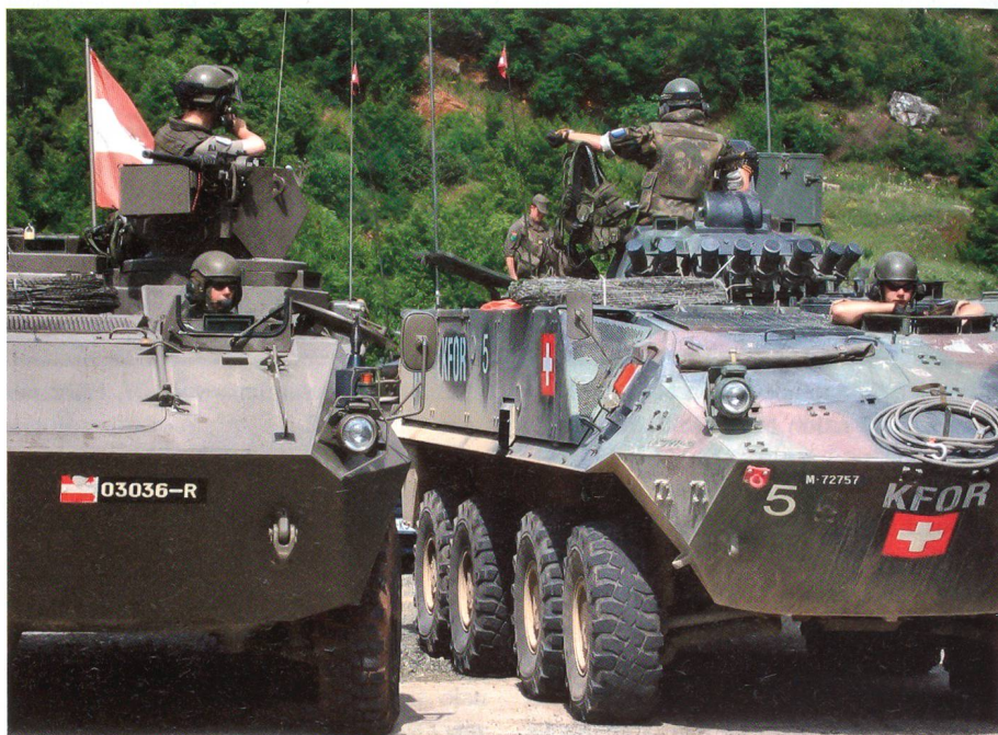
Partnerschaft im Kosovo: Österreicher und Schweizer errichten Strassensperre.

die Beschaffung von technologischen Systemen der Kommunikation und Aufklärung sowie vom präzisen Feuer eine intensive Evaluation brauchen.