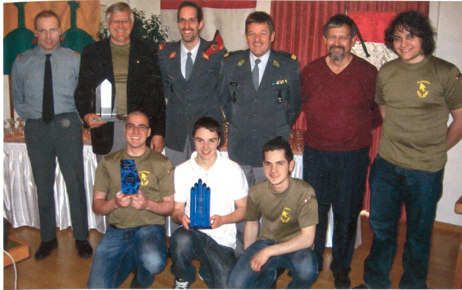
Erfolgreiche Sektion: Alle Auszeichnungen gingen an den UOV Grenchen.