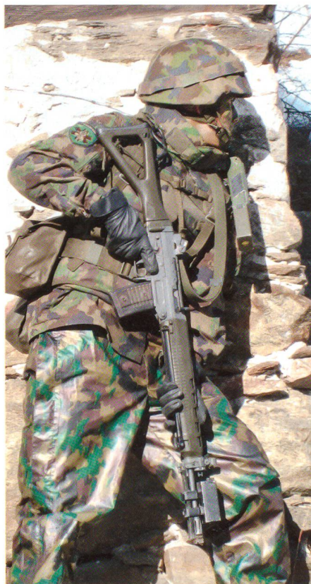
Immer im Dienst.

liegt, ist auf geringere Aufwände für die subsidiären Sicherungseinsätze zurückzuführen. Diese Einsätze machen mit 294 489 Dienstagen rund 70 Prozent der