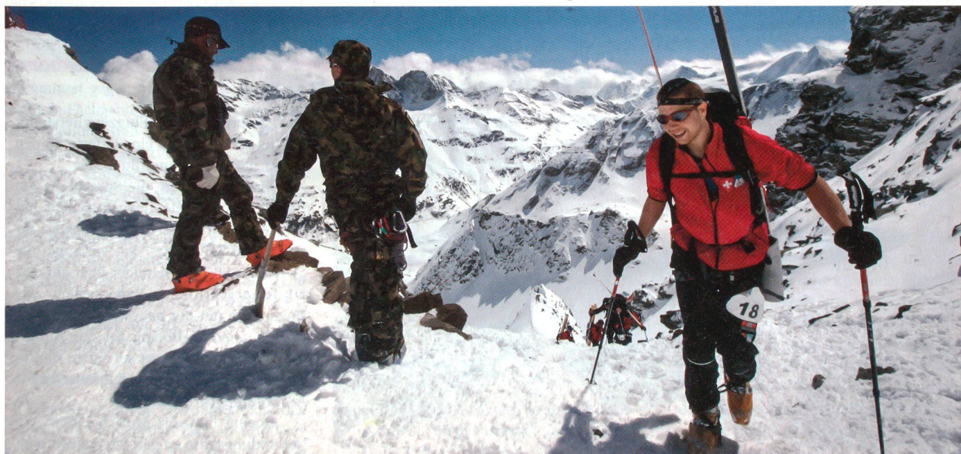
Nach schwerem Aufstieg, hier bei gutem Wetter.