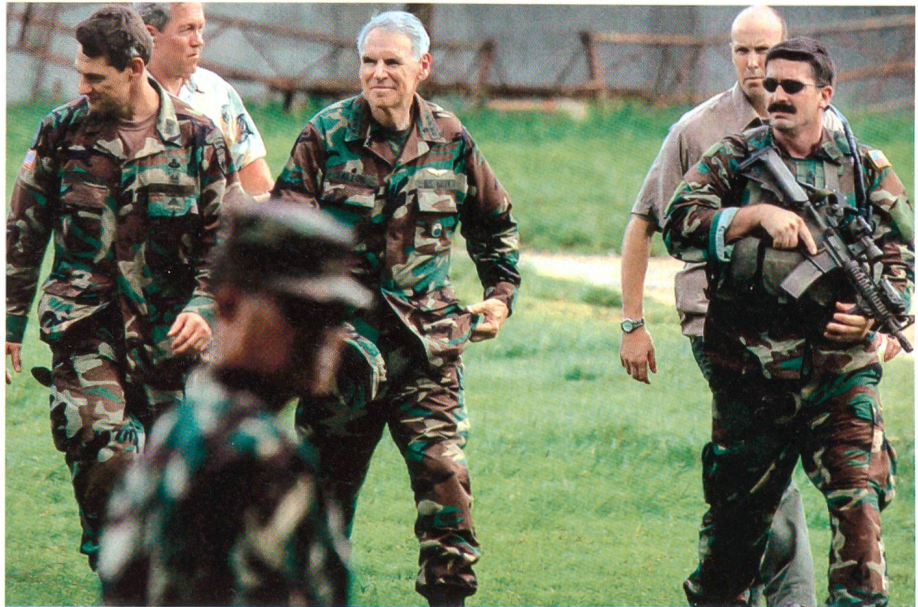
Der 63-jährige Admiral Fallon (Mitte) verlässt die amerikanischen Streitkräfte.

Der Streit eskalierte, als Petraeus begann, mit dem Präsidenten direkt zu verkehren – unter Umgehung des Dienstweges, der über Fallon führte. Petraeus berichtete Bush direkt über die Videokonferenz