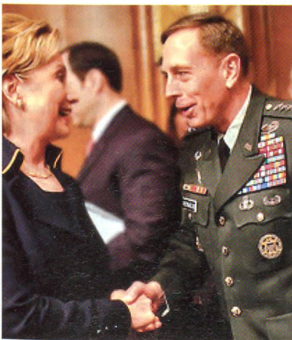
Senatorin Clinton und General Petraeus.