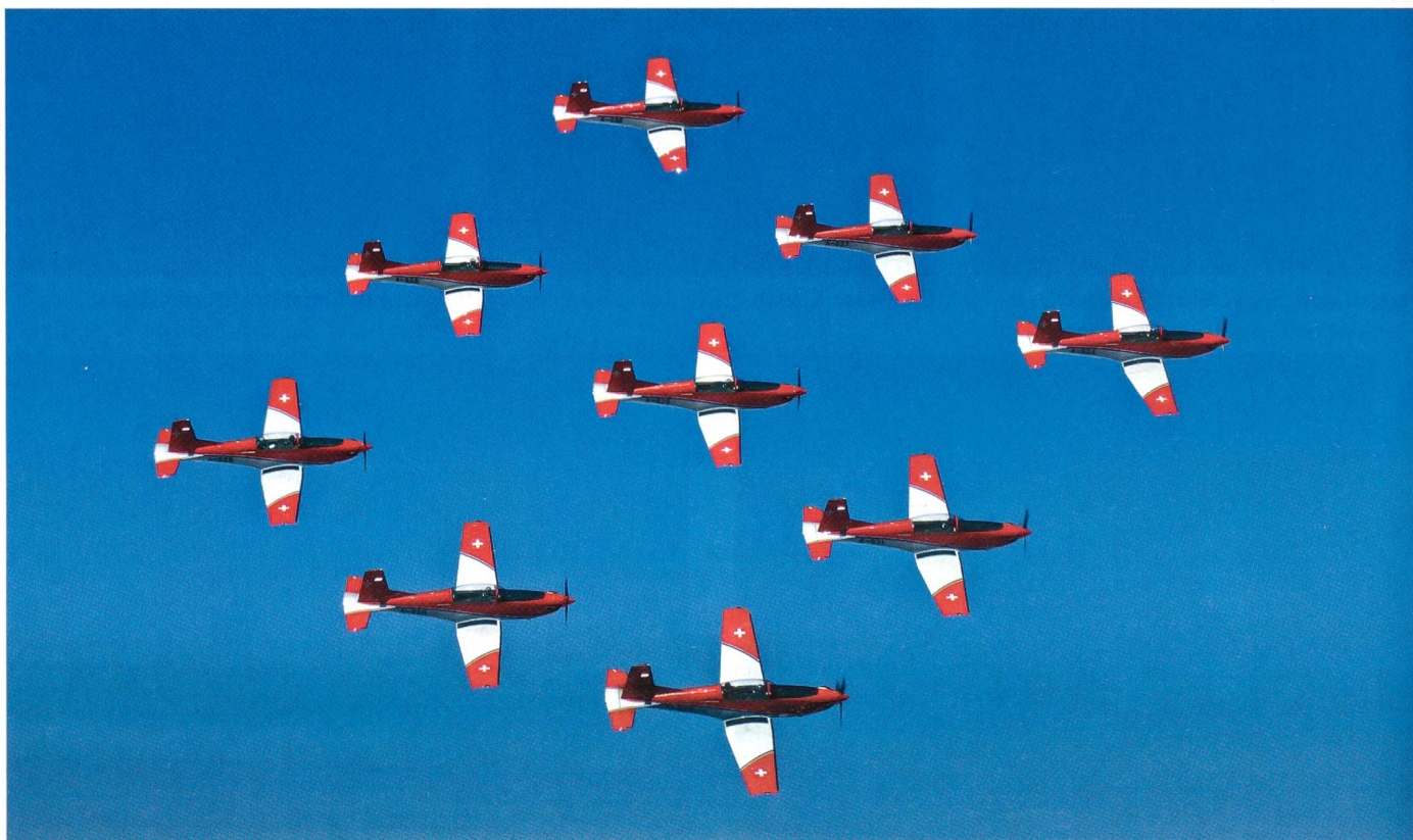
Kunstflug von neun Piloten in Perfektion.