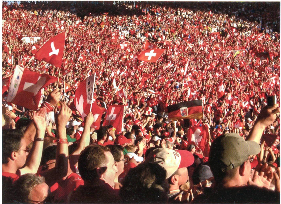
Friedliche Schweizer Fans an der Weltmeisterschaft 2006 in Deutschland.

Im Bereich Terrorismus wirken umfassende unsichtbare Sicherheitsvorkehrungen präventiv. Sie können Terroristen von