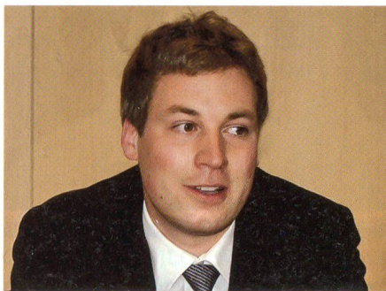
Nationalrat Lukas Reimann: «Nicht der Staat soll sagen, wo es hingehet. Wir alle suchen unseren eigenen Weg.»