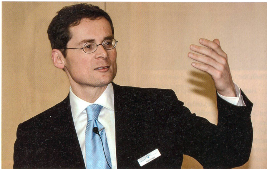
Roger Köppel, Verleger und Chefredaktor der «Weltwoche»: «Je stärker in einem Land die demokratischen Kräfte wirken, desto grösser ist der Willen auch zur persönlichen Freiheit.»