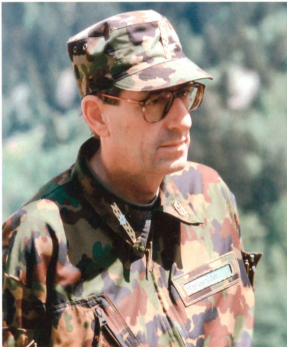
Alfred Markwalder als Brigadekommandant.

war Stabschef der Gebirgsdivision 9 sowie schliesslich auch nebenamtlicher Kommandant der Festungsbrigade 23 – der Gottard-Brigade – als Brigadier. Ich durfte viele intensive und schöne Momente im Rahmen meiner Dienstleistungen für die Armee und für die Schweiz erleben.