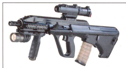
Steyr AUG A3.

Die neuseeländischen Streitkräfte haben mit einem Projekt zur Aufrüstung ihrer Infanteriewaffen begonnen. Dabei wird einerseits ein Teil der F88 Steyr-Sturmgewehre mit neuen optischen Zielhilfen ausgerüstet sowie neue und effektivere Munition im Kaliber 5,56x45 mm getestet. Mit Hilfe dieser Verbesserungen soll das Sturmgewehr noch weitere zehn Jahre bei den Streitkräften eingesetzt werden. Daneben muss ein Ersatz für das leichte MG Minimi sowie für die eingesetzten Pistolen SIG Sauer gesucht werden, da beide Waffensysteme bald das Ende ihrer Lebensdauer er-