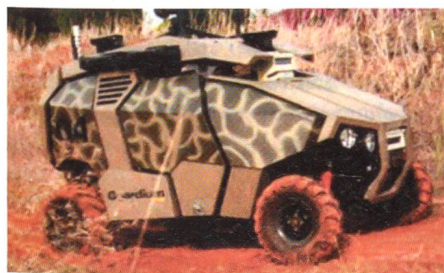
Guardium der israelischen Streitkräfte.

Die israelischen Streitkräfte sind bereit, das erste unbemannte Fahrzeuge für Grenzpatrouillen im Gazastreifen einzusetzen. Guardium kann eine Nutzlast von bis zu dreihundert Kilo mitführen und ist mit einem vollautonomen Fahr- und Navigationssystem ausgestattet. Das Fahrzeug kann entweder auf einer vordefinierten Route verschieben oder nachträglich in Echtzeit per Funk gelenkt werden. Guardium verfügt über rundum Tag- und Nachtüberwachung und kann so zu jeder Tages- und Nachtzeit