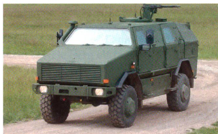
Mehrzweckfahrzeug Dingo 2.

Die luxemburgischen Streitkräfte haben 48 Fahrzeuge des Typs Dingo 2 als leichtgepanzertes Aufklärungsfahrzeug bestellt. Das Fahrzeug wird dabei einerseits mit mastmontierten Sensoren und andererseits mit einer tragbaren Wärmebildkamera ausgestattet. Zusätzlich wird ein Gefechtsführungs- und Kontrollsystem integriert, um Aufklärungsergebnisse schnell ins Netzwerk zu übermitteln und ständig ein aktuelles Lagebild zu haben. Zur Verteidigung verfügt der Dingo über eine fernbediente Waffenstation von Kongsberg sowie über einen Laserwarner, welcher mit Nebelwerfern gekoppelt ist.