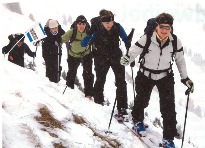
Frauenpower im Aufstieg.