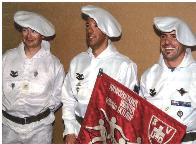
Paracadutisti Milano mit Preis (mit Beret, nicht Pizza).