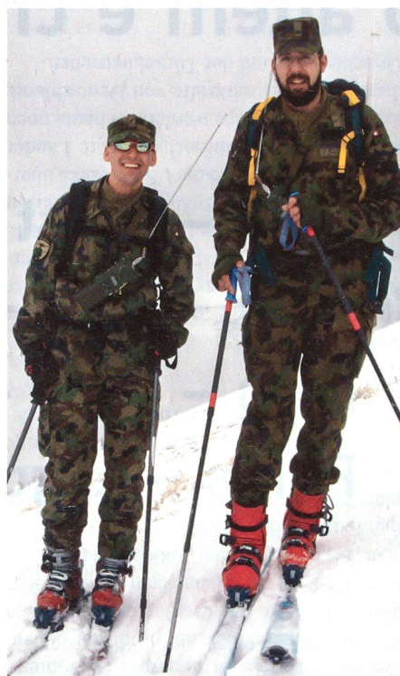
Die Pistenkontrolleure auf der Strecke.