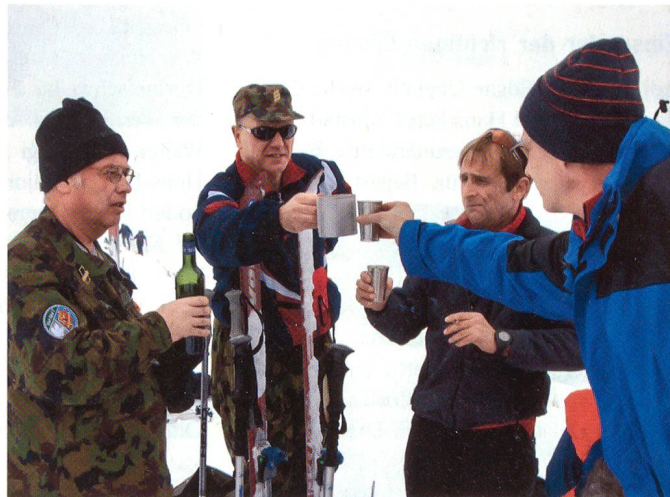
Auf dem höchsten Punkt, auf dem Rinderberg.