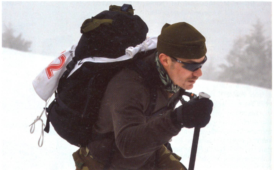
Mit vollem Einsatz bergauf.

Die ursprünglich am Samstag vorgesehene Strecke (Sparenmoos) musste kurz-