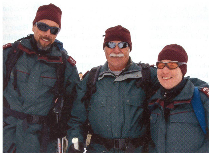
Patrouille der Grenzwoche.