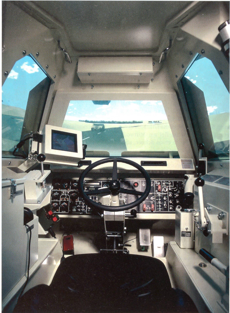
Ein moderner Fahrschulsimulator der RUAG.