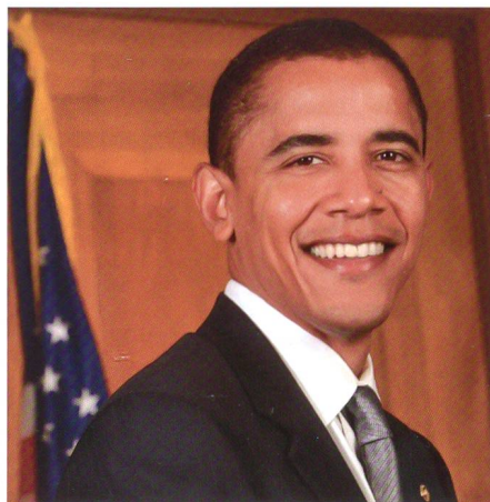
Barack Obama, der Senator des Bundesstaates Illinois, kämpft mit Hillary Clinton, der Senatorin von New York, um die demokratische Nomination für die amerikanische Präsidentschaftswahl vom 4. November 2008. Die Ernennung erfolgt an der Parteiversammlung der Demokraten vom 25. bis zum 28. August 2008 in Denver.

Michelle, meine Frau, ist die Liebe meines Lebens, sie ist die Mutter meiner Kinder.