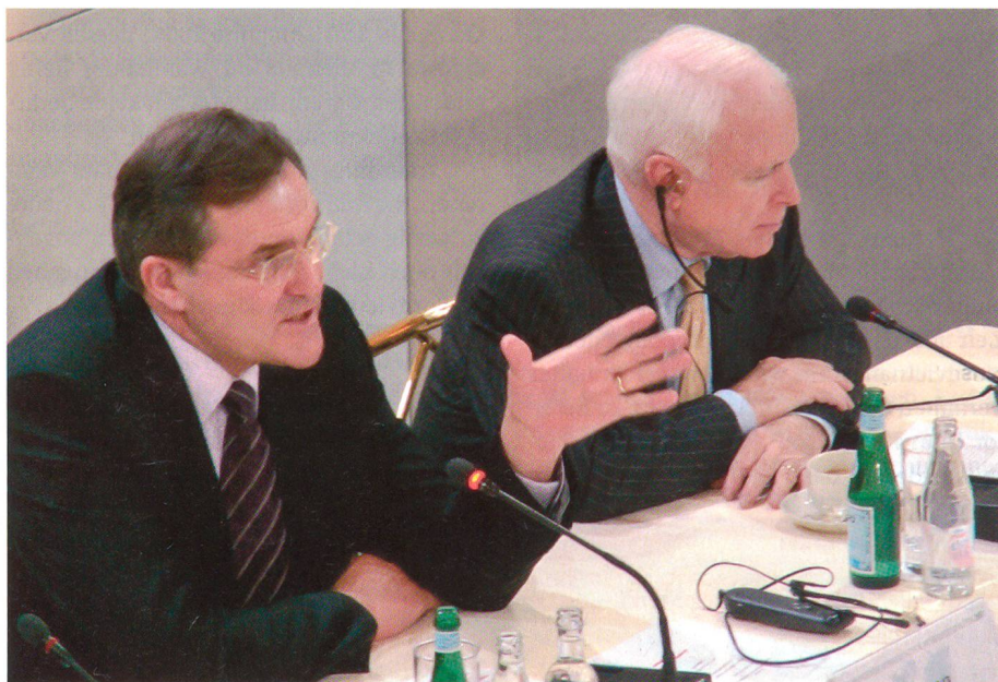
Senator John S. McCain III (rechts) an der Münchner Konferenz für Sicherheitspolitik 2007, links von ihm der deutsche Verteidigungsminister Jung. McCain nimmt seit Jahren an diesem Anlass teil und ist auch mit den Problemen europäischer Sicherheit bestens vertraut.

John S. McCain III (der heutige Senator) schloss 1958 die Marineakademie in Annapolis ab - wie zuvor sein Vater und