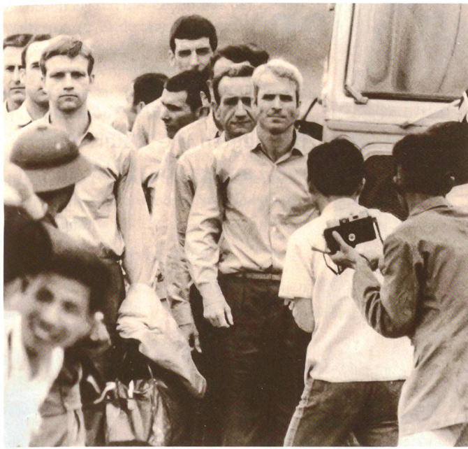
Am 14. März 1973 wird eine weitere Serie von insgesamt über 500 amerikanischen Kriegsgefangenen, darunter die meisten Flieger, aus der nordvietnamesischen Gefangenschaft entlassen. Diese Aufnahme, gemacht auf dem nordvietnamesischen Flugfeld von Gia Lam, zeigt einige Freigelassene, die auf den Rückflug in die USA warten. Unter ihnen John S. McCain III.