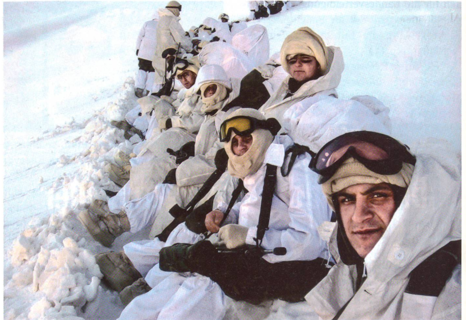
Türkische Soldaten im Nordirak. Die Türkei will ständige Stützpunkte ausbauen.