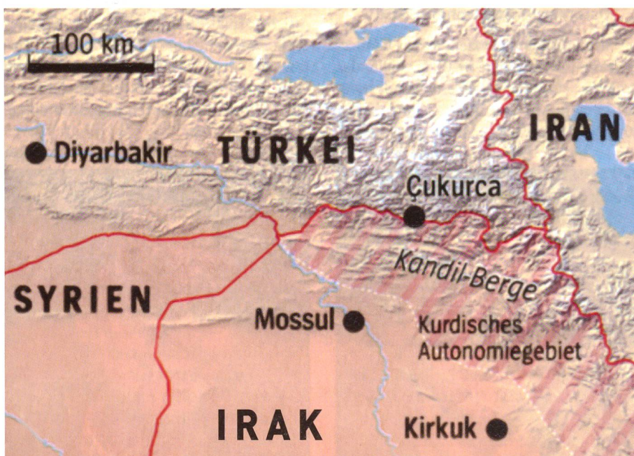
Das Grenzland von Irak und Türkei. Rot schraffiert das irakische Kurdengebiet.