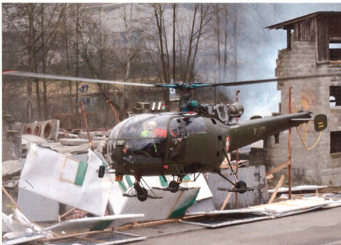
Helikopter greift ein.