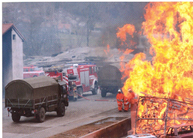
Es brennt lichterloh.