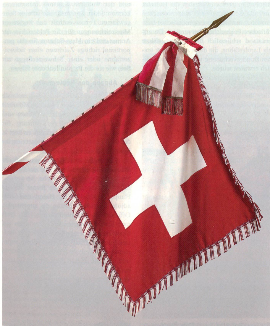
Das Titelbild des neuen Reglementes.

Die Armee verwendet auch zivile Schweizerfahnen. Werden sie aufgezogen – oder fachtechnisch ausgedrückt «gehisst» – hat das mit Rücksicht auf ihren Symbolgehalt in würdiger Form zu geschehen. Ein Kapitel nennt die Regeln und macht zudem