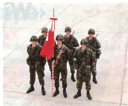
Ruhnstellung: Fahne mit der rechten Hand direkt unter dem Fahnentuch senkrecht vor den Körper halten.