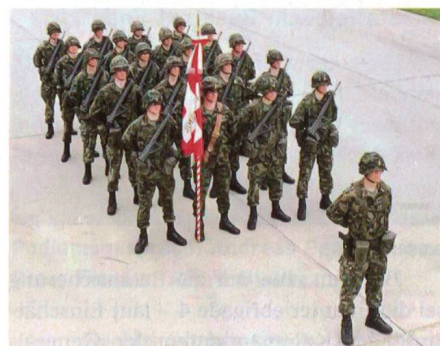
Fahnenzug oder Stabseinheit bei Fahnenübernahme.