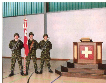
Je ein Unteroffizier links und rechts neben dem Fähnrich.