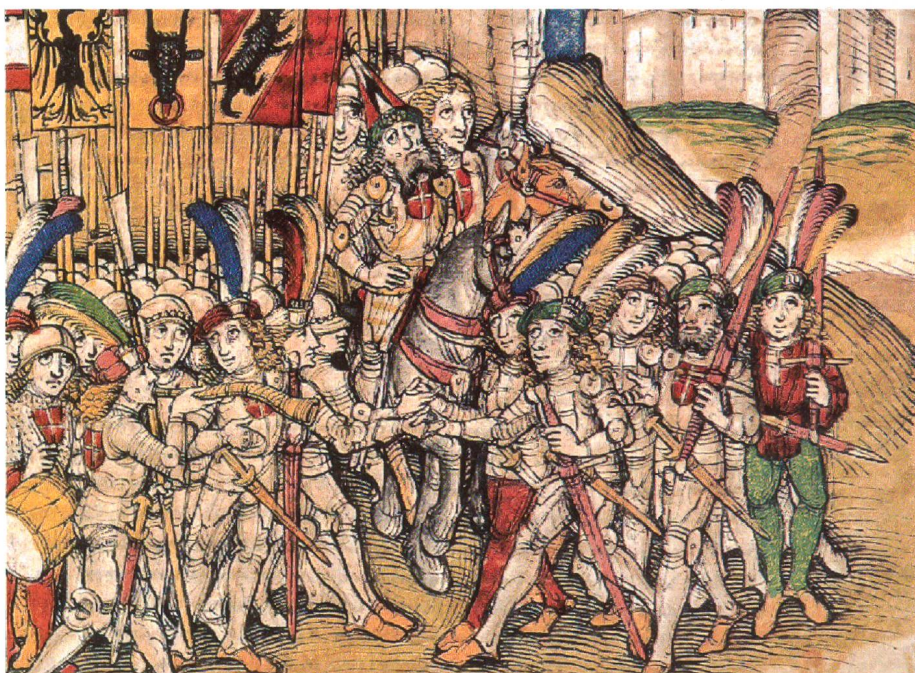
Darstellung der Schlacht bei Laupen 1339, gut erkennbar sind die auf die Brust genähten weissen Kreuze. (Spiez Chronik des Diebold Schilling)