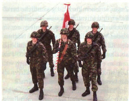
Freimarsch: Der Fähnrich trägt das Feldzeichen auf der rechten Schulter.