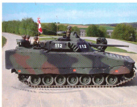
Tragart im Schützenpanzer 2000 mit der Fahnenwache.