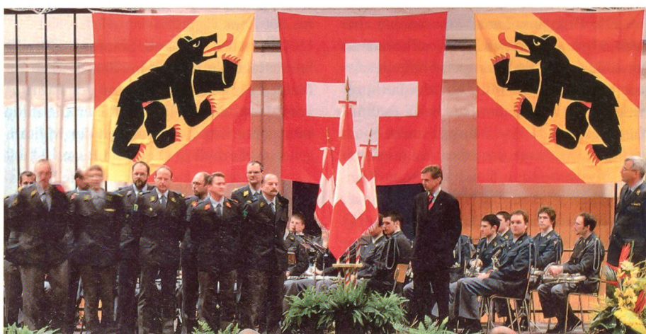
Beispiel einer Beflaggung mit Hängefahnen bei einer militärischen Feier des Kantons Bern. Zwei Berner Fahnen sind beidseits der Schweizerfahne symmetrisch aufgehängt.