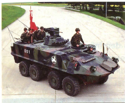
Tragart im Rad Spz 93: Lederköcher am vorderen Scharnier des rechten Mannschaftslukendeckels.