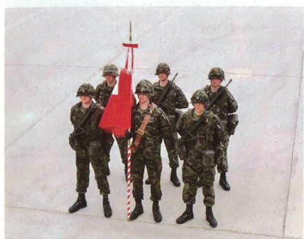
Je ein Unteroffizier links und rechts neben dem Fähnrich, dahinter drei Soldaten.