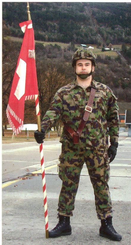
Ein Fähnrich in Ruhnstellung mit der Standarte.