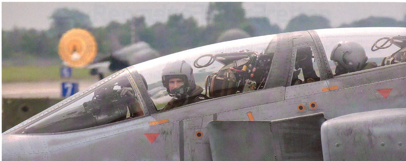
Zwei-Mann-Cockpit – Pilot und Waffensystemoffizier einer F-4F Phantom des Jagdgeschwaders 71 «R» aus Wittmund.