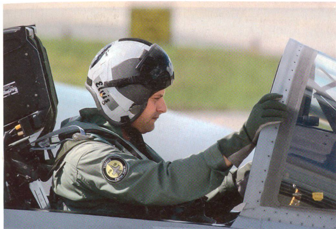
Hornet-Pilot bei den Vorbereitungen zum Start.