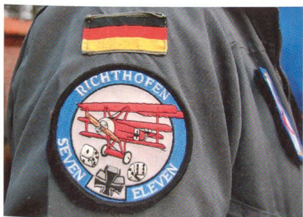
Staffelwappen der 1. Staffel des Jagdgeschwaders 71 «Richthofen».