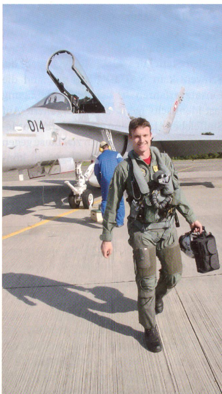
Schweizer Hornet-Pilot nach einem Trainingseinsatz.