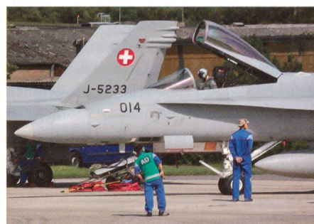
Schweizer Techniker überwachen das Anlassen der Triebwerke am Boden.