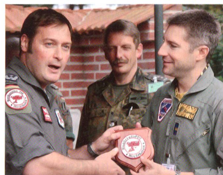
Der Staffelkapitän der 2. Jagdstaffel überreicht dem Schweizer Kommandoführer das Staffelwappen.