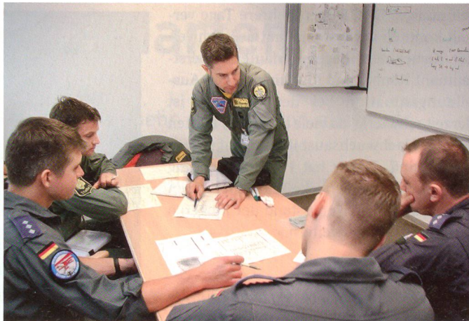
Schweizer und deutsche Besatzungen beim Briefing.