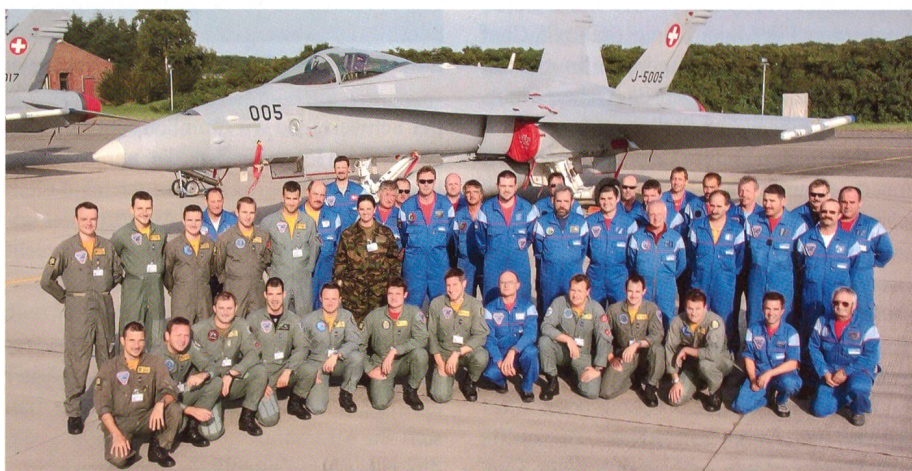
Schweizer Kommando beim Jagdgeschwader 71 «Richthofen» in Wittmund.