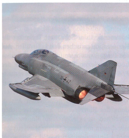
Startende F-4F Phantom des JG 71 «R».