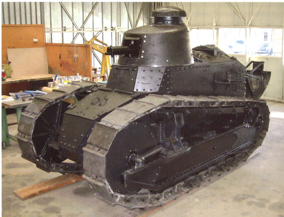
So präsentiert sich der noch motorlose «Renault FT 17».

2006 zeigte sich, dass die vielen Jahre im Freien dem Fahrzeug arg zugesetzt hatten. Als damaliger Kommandant des Lehrverbandes Panzer ordnete ich an, den Panzer in der Werkstatt komplett zu zerlegen. Bei diesen und weiteren Arbeiten zeigte sich: