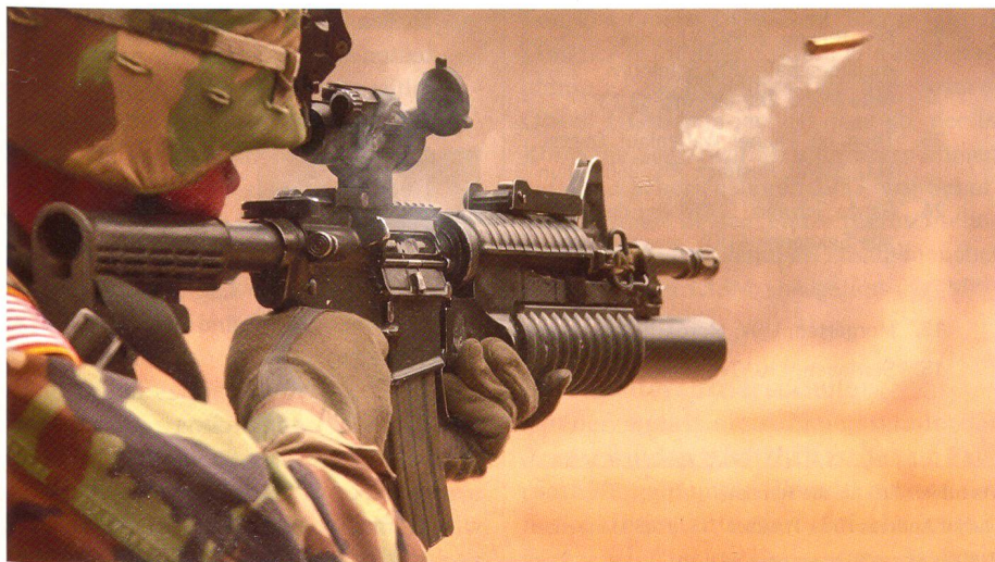
Das Colt M4 soll das M16 als Hauptbewaffnung der US-Bodentruppen ablösen.

Das spanische Verteidigungsministerium hat beim Schweizer Rüstungshersteller MOWAG eine Bestellung über zusätzliche 21 Piranha IIIC 8x8 aufgegeben. Die amphibischen