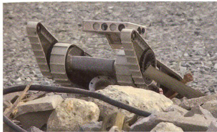
Small Unmanned Ground Vehicle (SUGV).

Die US Army drängt im Rahmen des Projektes «Future Combat Systems» auf die Auslieferung von Robotersystemen. So soll einerseits eine neue kleinere aber trotzdem leistungsfähige Überwachungsdrohne getestet werden und andererseits ein kleines unbemanntes Bodenfahrzeug zu Aufklärungs-