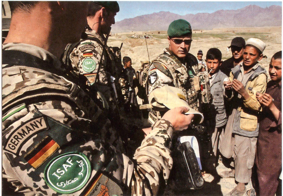
Deutsche Soldaten bei Bagram im Norden Afghanistans.

Den politischen Hintergrund bildet das Wahljahr 2009: Würde die Regierung Merkel jetzt Kampftruppen nach Südafghanistan schicken, dann würde sie mit Sicherheit die Bundestagswahl verlieren. In Deutschland besteht schon massiver Widerstand gegen das gegenwärtige Engagement der Bundeswehr in den Nordprovinzen. Wie Umfragen zeigen, lehnt die Bevölkerung den