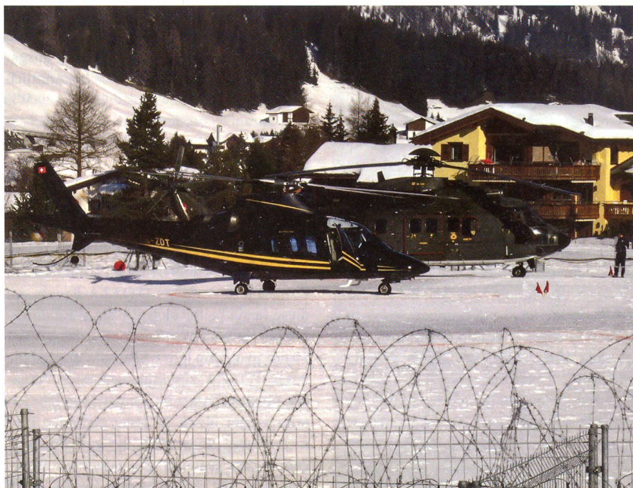
Stilli Mountain Heliport: Zivile und militärische Helis beisammen.