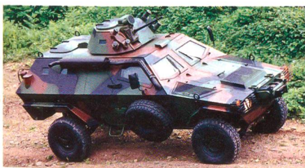
Otokar Cobra (Türkei).

Das Slowenische Verteidigungsministerium bestätigte, dass das ABC-Bataillon bis Ende 2008 10 ABC-Aufklärungsfahrzeuge des Typs Otokar Cobra aus türkischer Fertigung erhalten wird. Die sloweni-