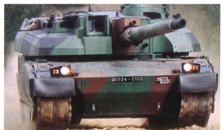
Kampfpanzer Leclerc (Frankreich).

Laut Quellen aus dem Verteidigungsministerium wurde mit dem staatlichen Rüstungshersteller Nexter – vormals GIAT – ein Notfall-Vertrag über die Produktion von Ersatzteilen für die 355 Leclerc-Kampfpanzer sowie 20 Leclerc-Bergepanzer, welche