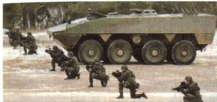
Patria AMV der Slowenischen Streitkräfte bei Demonstration

Das Slowenische Verteidigungsministerium hat am 18. Dezember 2007 den ersten von insgesamt 135 Patria 8x8 AMV (Armoured Modular Vehicle) erhalten. Das Fahrzeug wird nun bis im März durch die Truppe scharfen und intensiven Einführungstests unterzogen. Die slowenische Variante des AMV wurde von