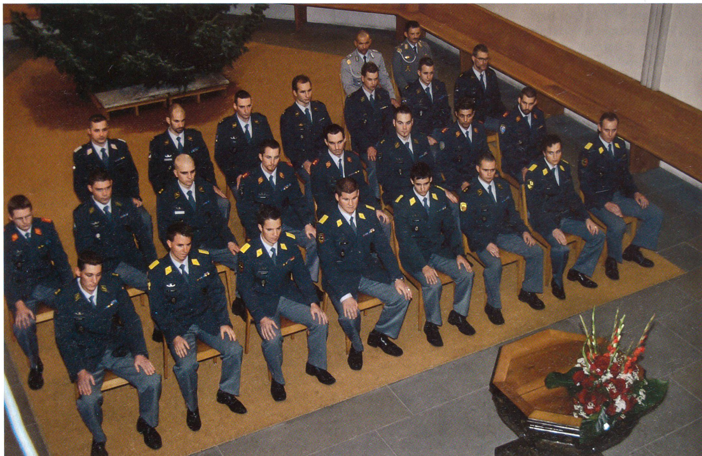
Die Absolventen des Grundausbildungslehrganges 2006-2007 an ihrer Diplom- und Beförderungsfeier in der Kirche Herisau.

Zusammen mit über 1000 Armeeangehörigen aus über 20 Nationen haben die BUSA-Absolventen anschliessend an den