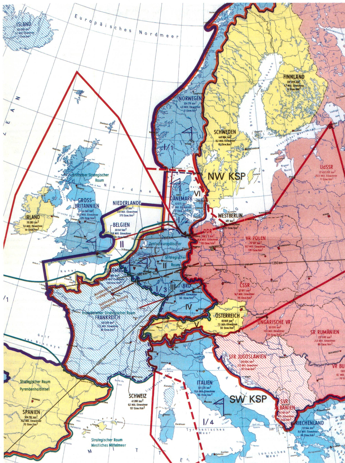
Übersichtskarte aus dem Militärgeographischen Atlas der NVA (1981).