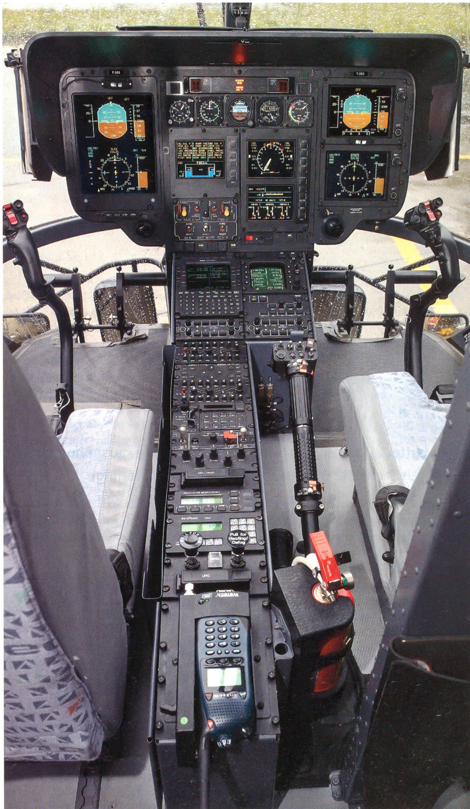
Blick in das EC635-Cockpit, welches mit jenem des Cougars vergleichbar ist.

Der EC635 unterscheidet sich von seinem zivilen Ebenbild insbesondere durch