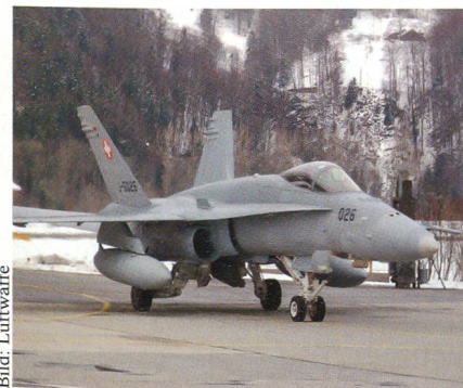
Der F/A-18 soll modernisiert werden.

In einer neuen Tranche sollen die insgesamt 33 F/A-18-Maschinen der Schweizer Luftwaffe erneut nachgerüstet werden. Nach der Investition von 627 Millionen Franken in den Rüstungsprogrammen 2001 und 2003 für Elektronik und Lenkwaffen ist im Rüstungsprogramm 2008 ein Kredit von «unter 400 Millionen Franken» vorgesehen.