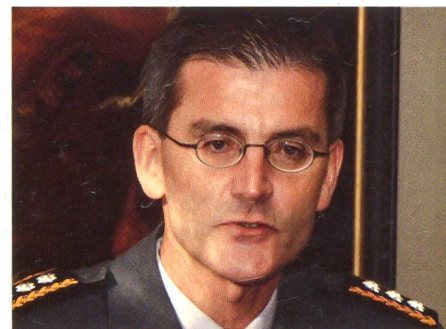
Im Amt: Nefs erste Ansprache als Cda.

tigem Respekt geprägte Zusammenarbeit und das Vertrauen, das er auch in kritischen Momenten immer wieder gespürt habe.