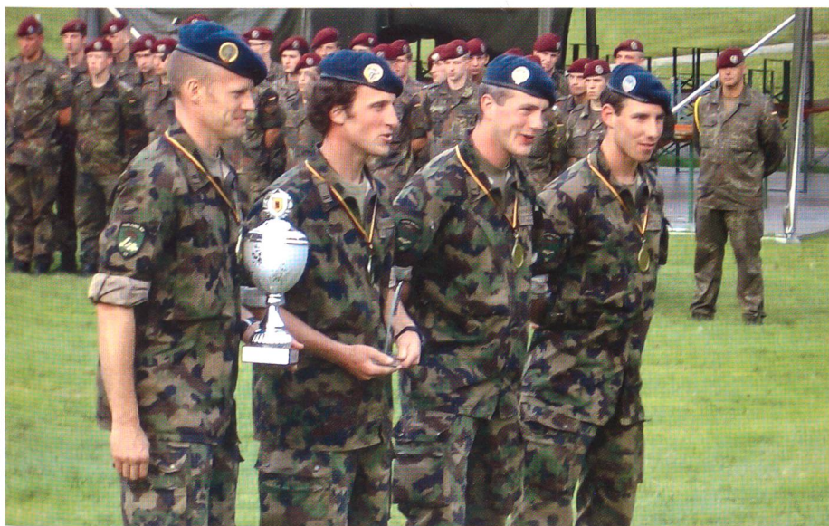
Das siegreiche 17-er-Team, alle Miliz.