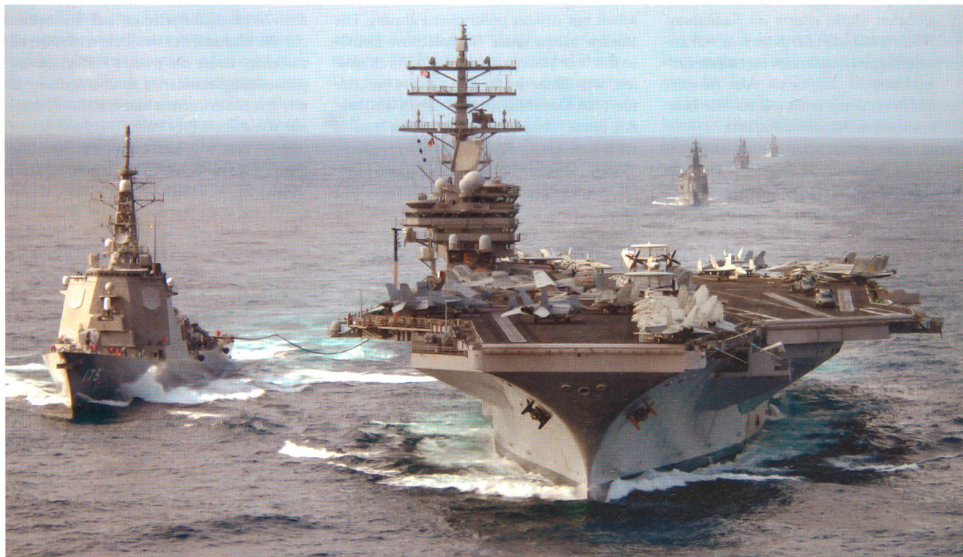
Die neue maritime Strategie postuliert, dass die US-Seestreitkräfte vermehrt die Kooperation mit Partnern, Alliierten und Freunden zu suchen haben, so wie hier der Atomflugzeugträger «USS Ronald Reagan» (CVN-76) mit dem japanischen Zerstörer «Myoko».

Zwischenzeitlich hatten andere Dokumente, sogenannte operationelle Konzepte, wie 1992 «From the Sea» und 1994 eine Aufdatierung desselben als «Forward – from the Sea» den laufenden weltweiten Veränderungen Rechnung getragen. Drei