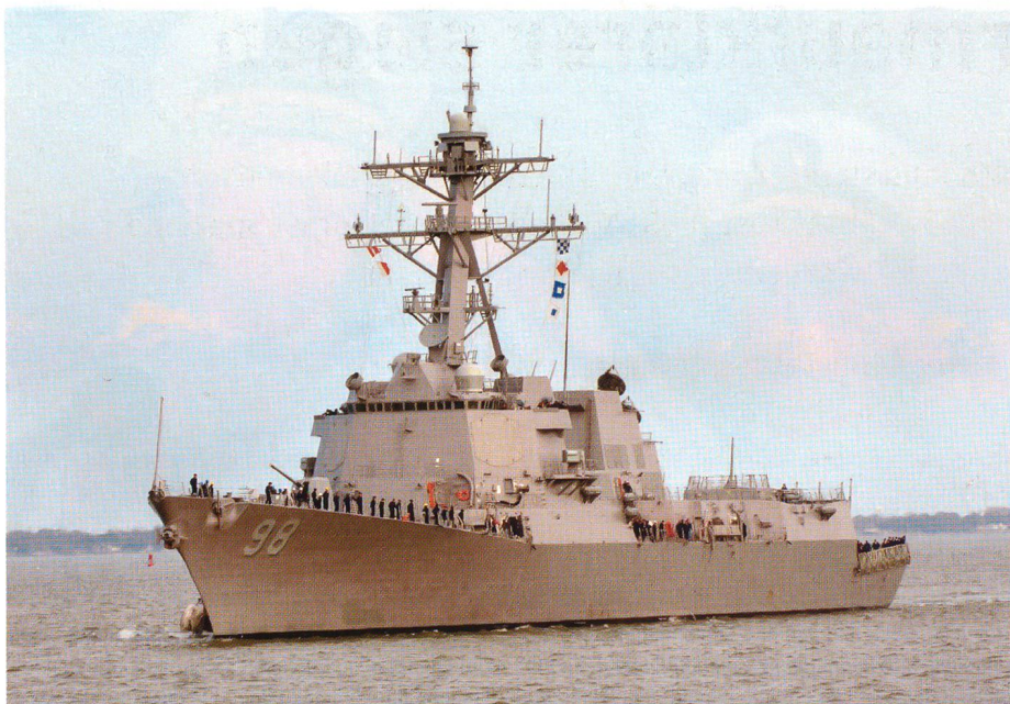
Der neue und hoch moderne Raketenzerstörer «USS Forrest Sherman», der eigentlich zur Kampfgruppe des gegenwärtig im Persischen Golf kreuzenden Flugzeugträgers «USS Enterprise» gehört, ist mit Sonderaufgaben an die Ost- und Westküste entsandt worden, wo er im Rahmen der neuen maritimen Strategie vertrauensbildende Aufgaben erfüllt und mit örtlichen Marinen kooperiert.

rine mit 1000 Schiffen versteht, sondern damit zum Ausdruck bringen will, dass alle Freunde, Partner und Alliierten inskünftig vermehrt zusammenarbeiten müssen, um die Herausforderungen dieser Zeit in enger Kooperation und gemeinsam meistern zu können. Dass dies zusätzliche gemeinsame Übungen und gleiche Verfahren erfordert, liegt auf der Hand.