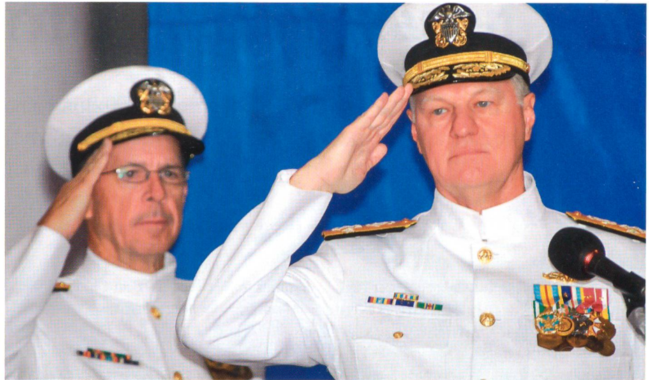
Admiral Gary Roughead (rechts) ist als Chief of Naval Operations (CNO) der neue höchste Marineoffizier der US Navy. Er hat von seinem Vorgänger, Admiral Mike Mullen (links), der jetzt neuer höchster Offizier der US-Streitkräfte ist, die Aufgabe übernommen, die neue maritime Strategie für die Marine umzusetzen.

Nicht zuletzt aus diesem Grund ist wohl auch die Idee der «1000-Schiff-Marine» von Admiral Mike Mullen geboren worden, der darunter nicht eine eigene Ma-