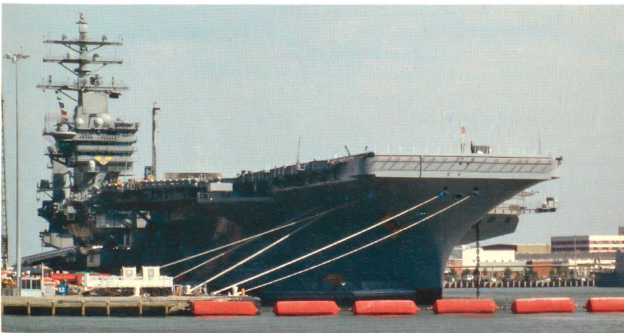
Atomflugzeugträger wie hier die «USS Carl Vinson» (CVN-70) im Marinestützpunkt von Norfolk, Virginia, werden auch weiterhin einen bedeutenden Anteil an der Erfüllung von Aufgaben der neuen maritimen Strategie haben.