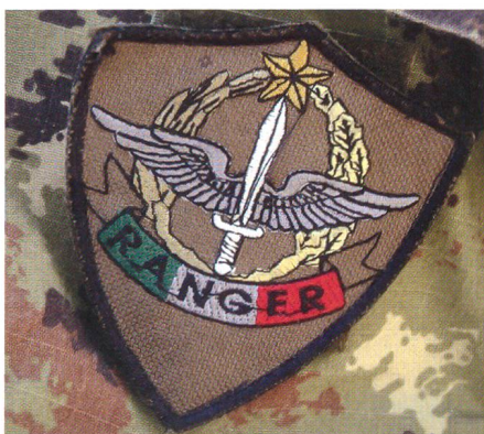
Abzeichen der Spezialeinheiten.

Es führt Unterstützungsoperationen für die Incursori Arditi (Spezialkräfte) durch und die Gebirgsfallschirmjäger besitzen alle eine Ranger-Qualifikation. Der Monte-Cervino-Verband hat seinen Sitz in Bozen und untersteht truppendienstlich dem Gebirgstruppenkommando. Sein Motto lautet «Mai Strack», was aus dem italienischen südtiroler Dialekt soviel heisst wie: «Nie müde» oder «Niemals fertig».