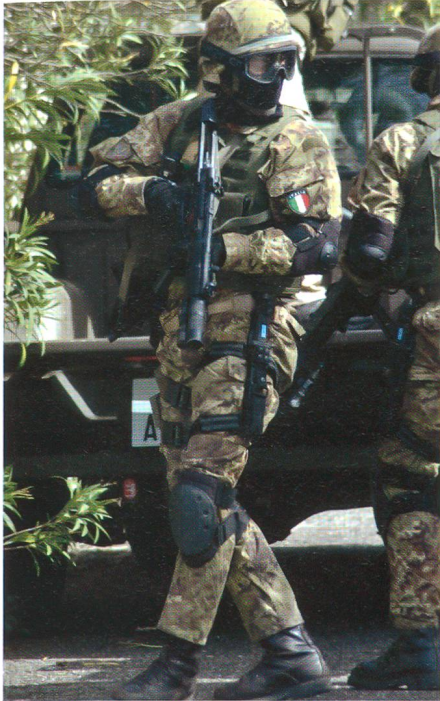
Geiselbefreiung auf Sardinien.