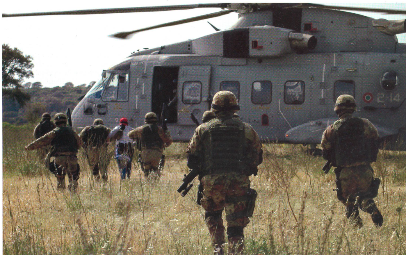
Evakuierungsmanöver auf Sardinien.

Auf dem Rückflug der leeren C-130-Transportmaschine, die nur den Autor mit zurückführte, ereignete sich jedoch ein schlimmes Unglück. Zwei F-16-Jäger des Begleitschutzes kollidierten in der Nacht beim Ausweichmanöver vor den Augen der HERCULES-Besatzung und stürzten in die rauhe schwarze See zwischen Sizilien und Sardinien. Beide Piloten konnten vom SAR-Dienst gerettet werden. Neben der Alpin- und Kampfausbildung gehört natürlich der Fallschirmsprung mit Automatikschirmen