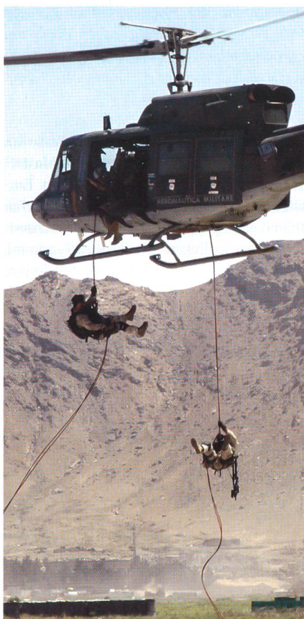
Abseilen am Flughafen von Kabul.

Ein ganz besonderer Verband innerhalb der italienischen Eliteeinheiten ist sicherlich das bereits angesprochene Gebirgsfallschirmjäger-Regiment Monte Cervino (übersetzt: Matterhorn). In den früheren Jahren seiner Geschichte war es eine Alpini- und somit eine eher konventionelle Gebirgsjagereinheit. Das 4. Reggimento Alpini Paracadutisti zählt seit kurzer Zeit zu den Sondereinheiten und hat in der letzten Zeit seine sowieso schon hohen Eintrittsanforderungen erheblich angehoben.