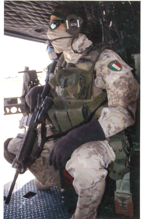
Patrouillenflug über Kabul.

und Freifallflächenschirmen zum Tagesgeschäft der Ranger. Neben der harten und fordernden Ausbildung spielen die Einsätze eine grosse Rolle im Leben eines Monte-Cervino-Gebirgsfallschirmjägers. Neben verschiedenen kleineren Einsätzen im Rahmen der Operation Iraqi Freedom in und rund um Nassirihja, werden auch immer wieder Detachements nach Afghanistan abkommandiert. Unter anderem ergab sich die Möglichkeit, die Ranger im Jahr 2005 und im Jahr 2006 auf ihren Patrouillen rund um Kabul und ihr Camp Invicta zu begleiten. Zum Teil handelte es sich um die gleichen Gebirgsfallschirmjäger, die man schon auf den Einsatzübungen begleitet hatte.