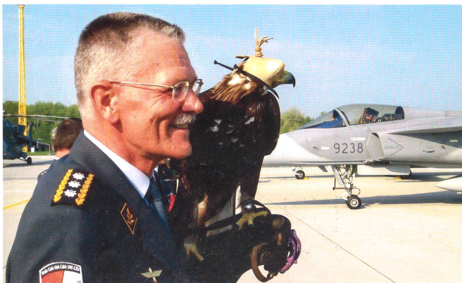
Bei einem Besuch des Luftstützpunktes von Czeslaw in der Tschechischen Republik macht der Chef der Armee Bekanntschaft mit einem Falken, der den Flugplatz von Vögeln freihält, die den Flugbetrieb gefährden könnten.

Einiges – nicht viel – hat den abtretenden Chef der Armee auch geärgert, wobei er kaum darüber sprach, schon gar nicht in der Öffentlichkeit. Ein Beispiel: Er war überzeugt von der Notwendigkeit, dass nach einem langen Prozess der Entscheidungsfindung einmal gefällte Entscheide loyal mitgetragen werden. Das war sein Verständnis einer Kultur, wie sie in höheren Offizierskreisen