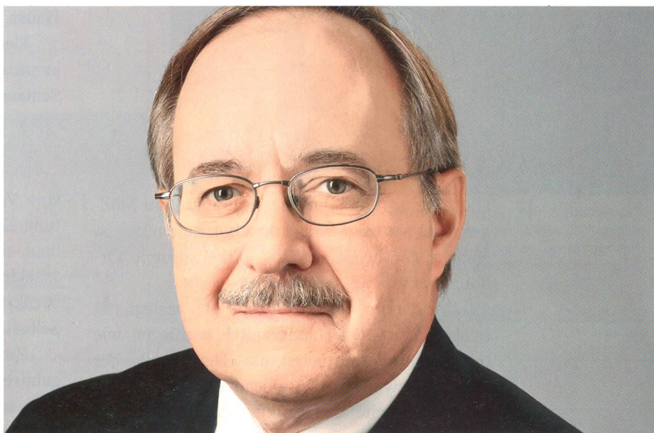
Am 31. Dezember 2008 verlässt Samuel Schmid den Bundesrat und das VBS.

1972 wurde er als 25-jähriger Gemeinderat von Rüti bei Büren, zwei Jahre später Gemeindepräsident. Von 1982 bis 1993 ge-