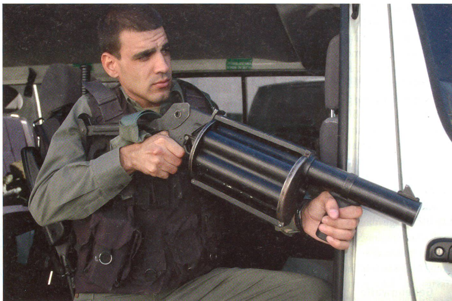
Mit dem Multi-6 Shot Launcher in 37/38 mm von Combined Tactical Systems lassen sich nicht nur Unruhen beenden, sondern man kann auch seine Kollegen der Special Patrol Unit damit wirkungsvoll decken.

Damit keiner zu bequem wird, wenn er es bis in die Special Patrol Unit geschafft hat, werden alle drei Monate fordernde Sporttests und Schiessübungen durchgeführt um zu sehen, wie die aktuellen Leis-