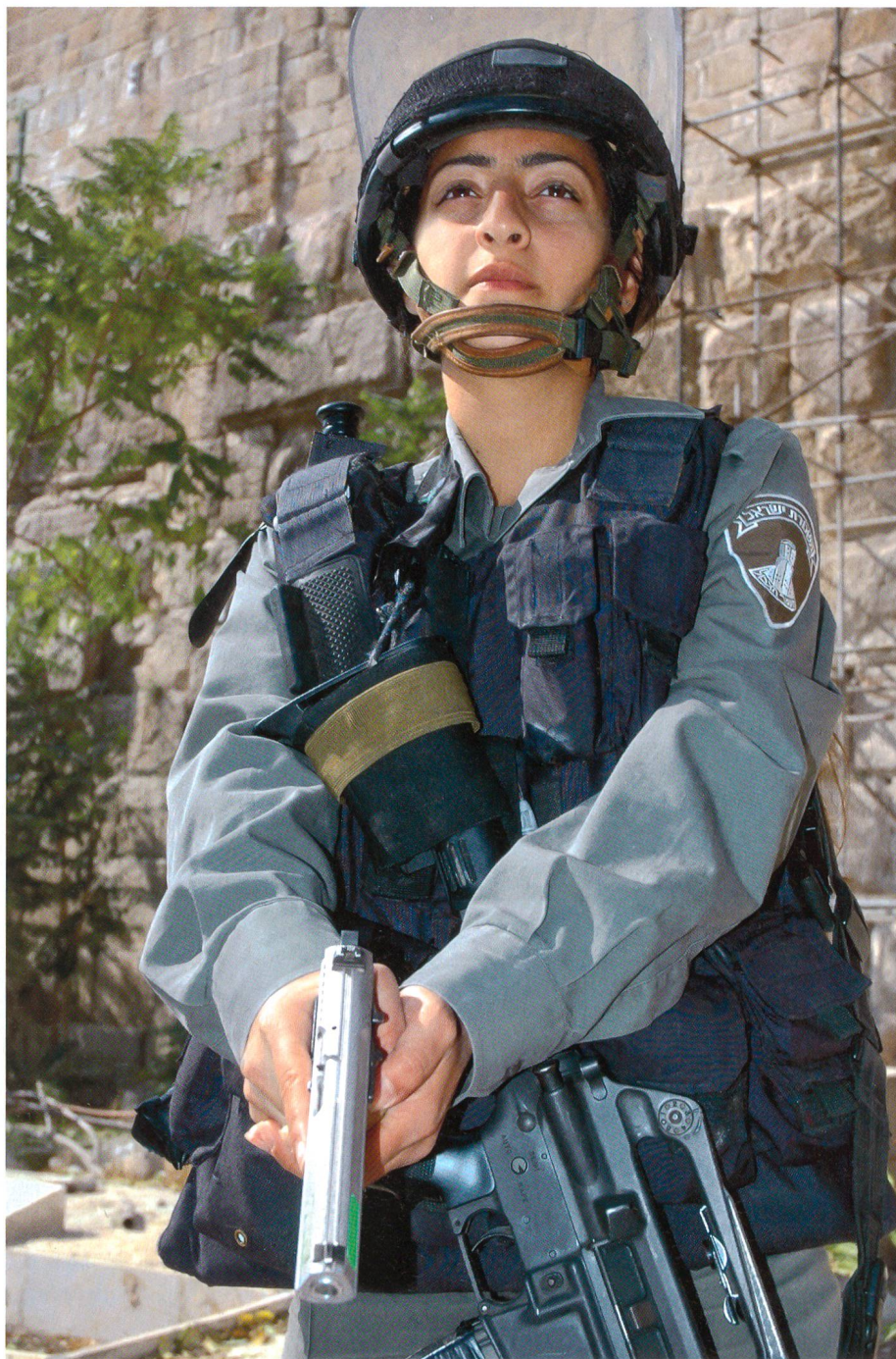
Eine Samag Polizistin sichert mit ihrer Jericho 9 mm den östlichen Teil der Klage-mauer in Jerusalem. Auch Frauen leisten bei Eignung ihren zweijährigen Wehrdienst in dieser Sondereinheit.

Viele erkennen sogar anhand des Dialektes und der Kleidung, ob ein Verdächtiger, der in der Innenstadt von Jerusalem aufgegriffen wurde, aus Gaza, Jenin, Hebron oder sonst woher stammt, völlig unabhängig seiner wahrscheinlich gefälschten Papiere. Diese Insider-Kenntnisse der Polizisten stehen in keinem Lehrbuch, sondern diese Informationen bringen die Sonderpolizisten aus ihren eigenen Kulturkreisen mit, in denen sie in Israel aufgewachsen sind. Wie sonst könnte man eine Selbstmordattentäterin erkennen und stoppen, die sich im jüdischen Viertel von Jerusalem in die Luft sprengen will und sich vielleicht optisch erstmal nicht von einer Touristin oder Pilgerin unterscheidet? Dies ist keine graue Theorie, wie so oft in deutschen Beamtenstuben, sondern angewandte und er-