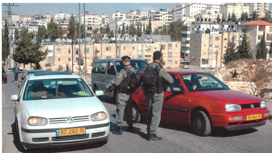
Strassenkontrolle auf Schleichwegen. Die Beamten der Special Patrol Unit sind auf der Suche nach gestohlenen Fahrzeugen, die wegen den unauffälligen israelischen Nummernschildern und Fahrzeugtypen gerne für Autobomben und Drogenkurierfahrzeuge genutzt werden.

tungsstandards sind. Auch werden laufend psychologische Tests abgefordert. Bei einer Patrouille in der Altstadt konnten sogar eigene Erkenntnisse und Eindrücke gewonnen werden. Jedoch sind die Händler und Bewohner der Gassen natürlich nicht das Ziel dieser Aktion, sondern zwielichtige Gestalten, die die Polizisten nur anhand der Kleidung, des Dialektes und der Verhaltensweise sofort selektieren und Fremde unmittelbar stoppen.