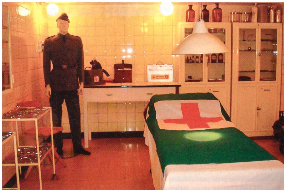
Sanitätsdienst in der Festung: ein Operationssaal.

Hier sei aber betont, dass FORT – CH / Festungen – Schweiz nicht Eigentümer der Festungsanlagen ist. Die Anerkennung für die Leistungen zur Rettung dieser wichtigen historischen Substanz gebührt den