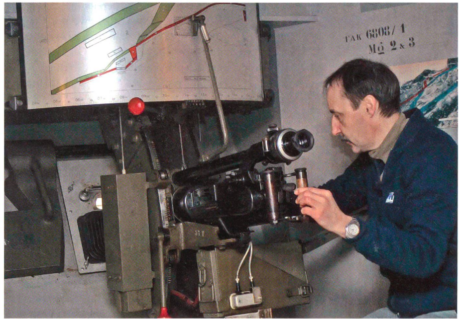
Grosser Wert wird auf die Pflege der Waffen gelegt – auch in alten Festungen.

Unter der Geheimhaltung entstand sogar im Verlaufe der Zeit ein eigentlicher Festungsmythos, der sich im Bild des wehrhaften Igels bildhaft manifestiert, der die unterirdischen Anlagen in der Phantasie,