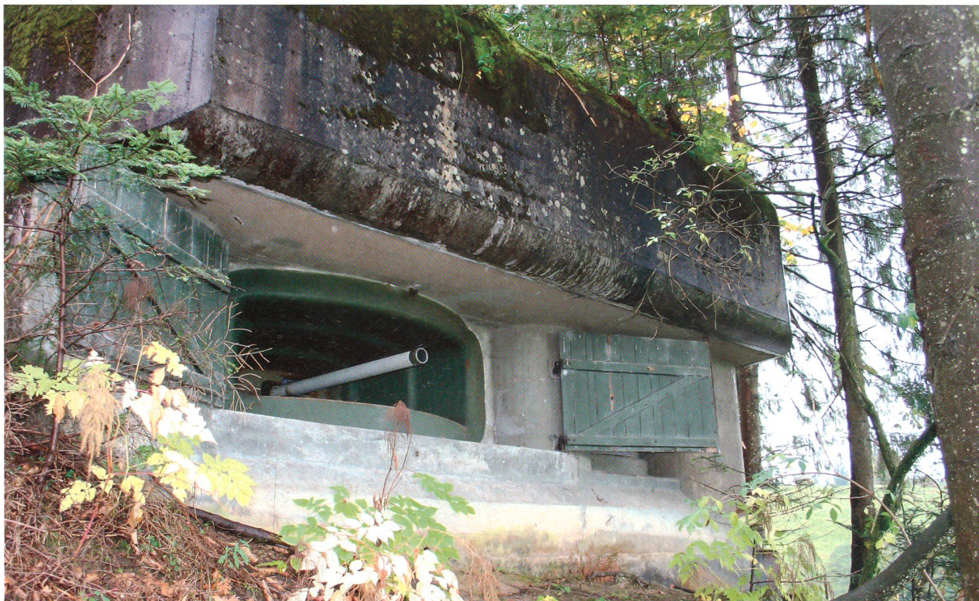
Gut getarnter Bunker auf dem Zugerberg.

Das Festungsdispositiv erhielt nach dem Zweiten Weltkrieg ein europaweit ein-