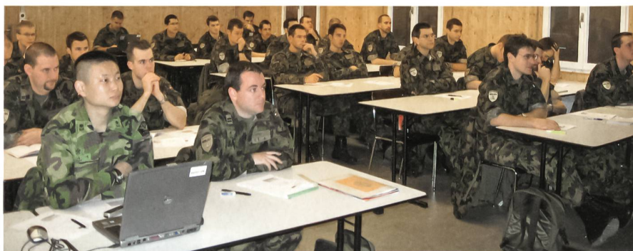
Ausländische Lehrgangsteilnehmer an der HKA.