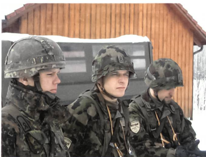
Klasse 2 in Neuchlen-Anschwilen.