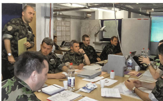
Lehrkörperausbildung der HKA.

Dank der konsequent durchgeführten Kursnachbearbeitungen (AAR) fliessen Verbesserungspunkte, die durch die Gr C, die Lehrgangsorganisation oder durch das Feedback der Teilnehmer auftauchen und wel-