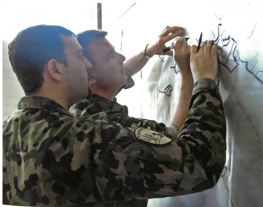
Unter Zeitdruck Lösungsvorschläge mit Varianten ausarbeiten.