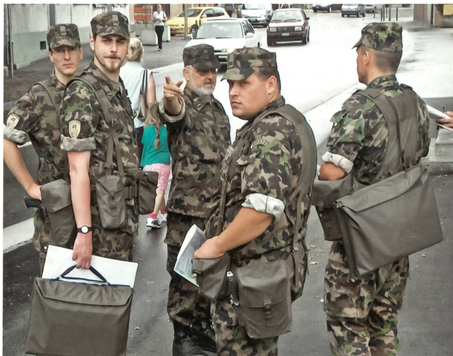
Augenschein im Gelände ist Teil des Entscheidungsfindungsprozesses.

Der FLG II (Modul 2) dauert zwei Wochen und wird gemeinsam mit den angehenden Führungsgehilfen Stufe Truppenkörper