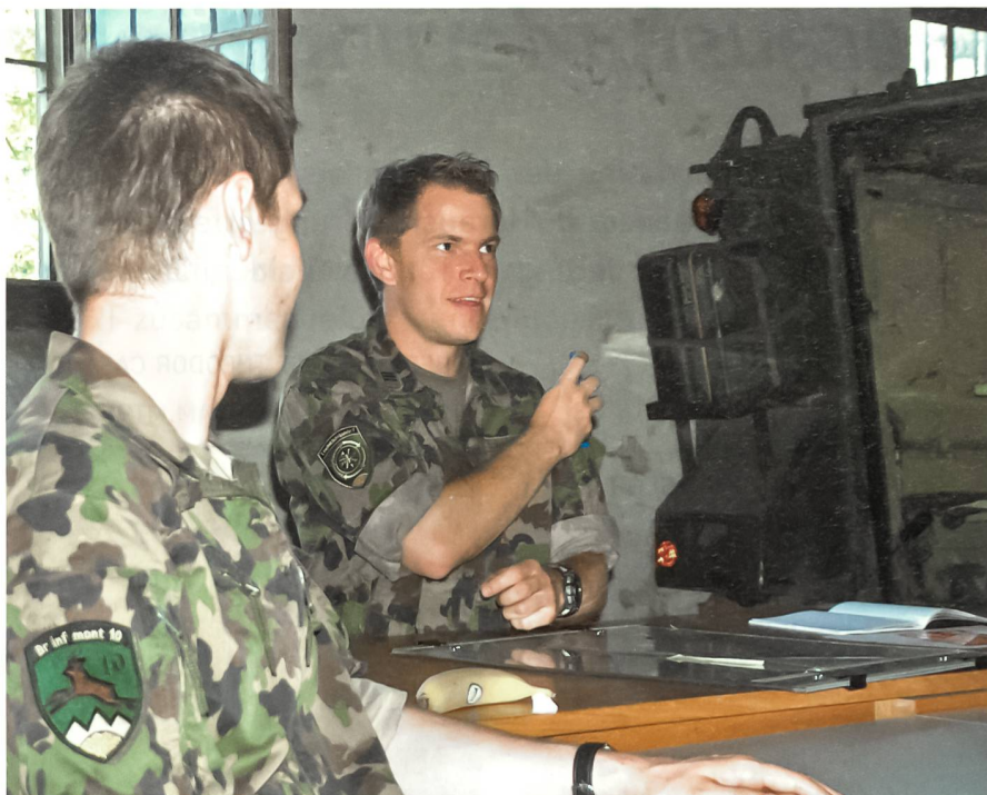
Auf dem Führungssimulator die Aktionsführung trainieren.

Eine der täglichen Herausforderungen besteht darin, ob den beschriebenen und zahlreichen weiteren peripheren Aktivitäten unser Kerngeschäft und die damit verbundenen Ziele nicht aus den Augen zu verlieren. Im Zentrum steht eine qualitativ hochstehende militärische Führungsausbildung. Der Kdt HKA spricht in diesem Zusammenhang in seinem Leitbild von «Spitzenleistungen».