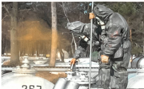
Die Arbeit in der Nähe der Tanks mit Melange ist nur noch in Schutzanzügen möglich.