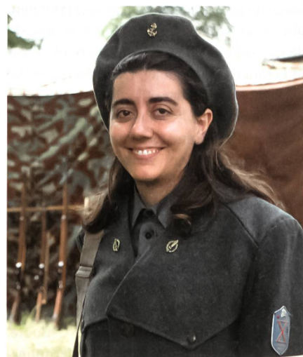
Aus Italien angegeist.