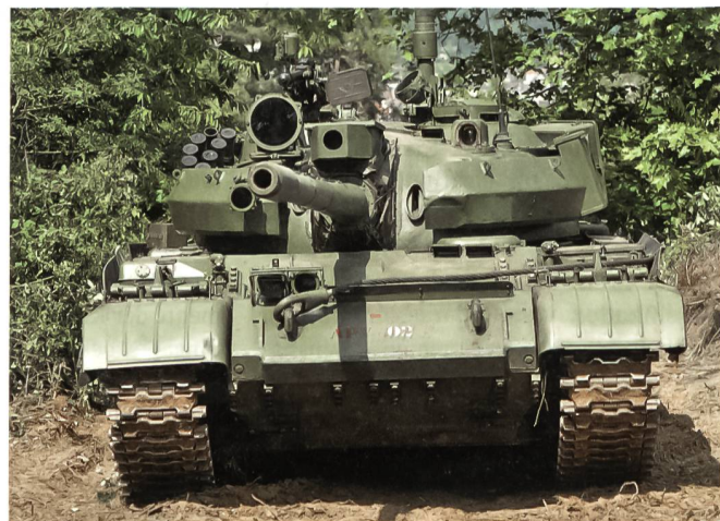
Vorführung des ehemaligen WAPA-Panzers T-55.